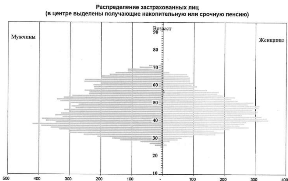
Рисунок 3. Распределение застрахованных лиц по полу и возрасту.

Сведения о распределении застрахованных лиц представлены в Приложении 6. На рисунке ниже представлено распределение застрахованных лиц по полу и возрасту по состоянию на отчетную дату.